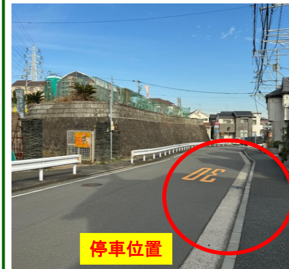
⑨シェア畑戸塚矢部向かい