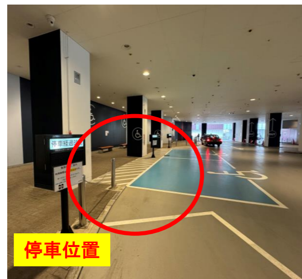
⑫戸塚区役所 1F交通広場