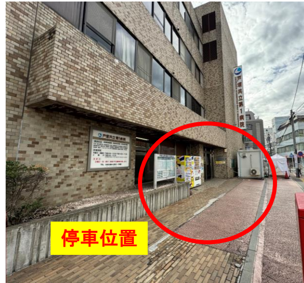
乗車場所 戸塚共立第1病院