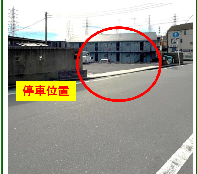
⑩メゾンラフィーヌ