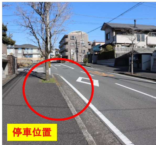
⑥戸塚鳥が丘ホール前