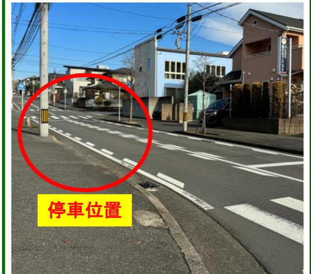
⑤鳥が丘クリニック向かい