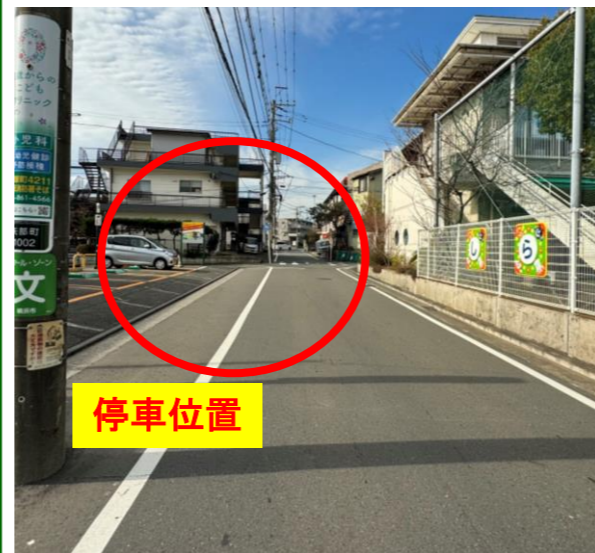
⑧しらかば幼稚園向かい