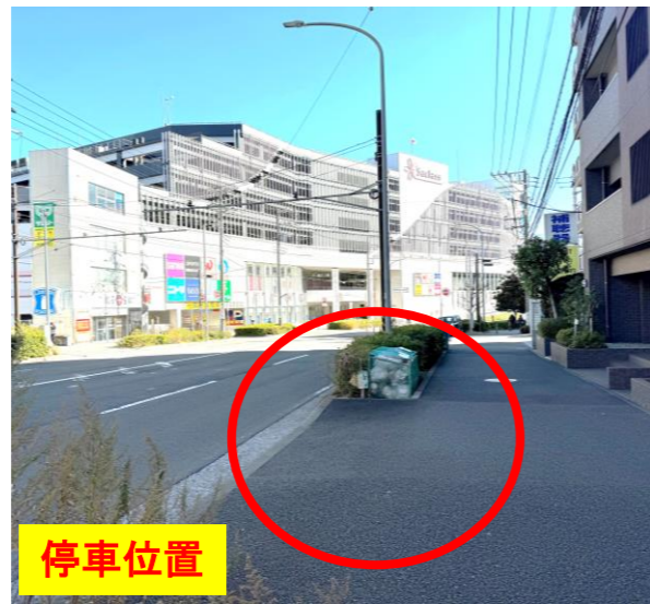
②サンヴェール戸塚